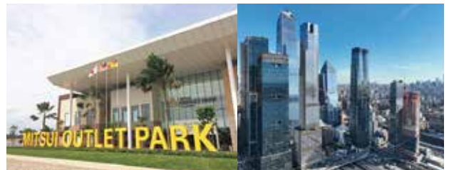
三井アウトレットパーククアラルンプール国際空港セパン ハドソン・ヤード

欧米のビル・ホテル事業だけでなく、成長するアジアでの開発事業も手がけ、三井不動産グループの活躍舞台は地球サイズ。各国地域に適したクオリティの高い商品、サービス提供を追求して、グローバルな実績を築きます。