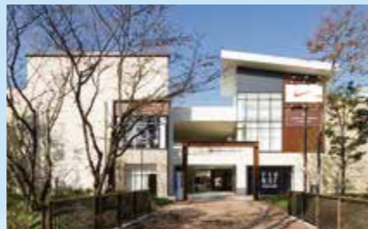
三井アウトレットパーク 倉敷

三井アウトレットパークシリーズ11施設目として、岡山県倉敷市に誕生。国内外のブランド約120店舗がそろった中四国最大級のアウトレットモールです。