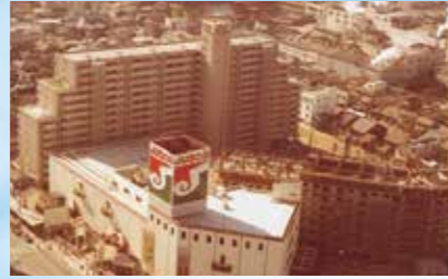
みゆきパーク・マンション

1978年、中国エリアでは当時最大規模の都市再開発型マンション。広い公園、ショッピング、医療施設、銀行、駐車場が整った新しい考え方の生活環境を創出しました。