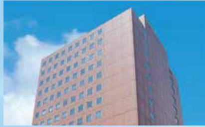
広島三井ビルディング

1977年、ビジネスの中心地「中区大手町」に都市型オフィスビルとしてオープン。現在も、広島エリアの中核を成すオフィスビルとして、その地位を維持続けています。