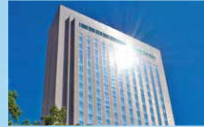
中町三井ビルディング、三井ガーデンホテル広島

1989年、広島市都心部の平和大通りに、オフィスとホテルの複合用途ビルとして誕生。ビジネス、観光の拠点として多くのお客さまにご利用いただいています。