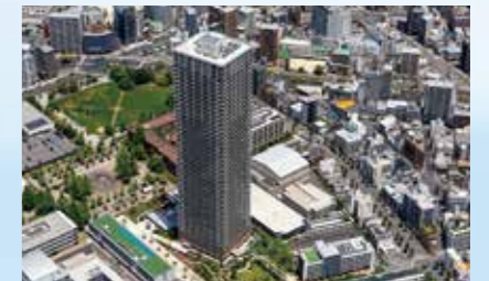
hitoto広島 The Tower

広島市が提唱した「ひろしま「知の拠点」再生プロジェクト」の象徴として誕生した「hitoto広島 The Tower」。地上53階建・総戸数665戸の広島を代表するタワーマンションプロジェクトです。