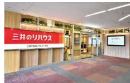
三井のリハウス 横川駅前センター

三井のリハウスは、住まいの売買・賃貸をお考えのお客様に不動産の売買仲介に関するサービスを提供しています。全国に287店舗(2023年4月現在)を展開し、地域の情報に詳しいスタッフが住まいや暮らしに関する情報を提供し、一人ひとりのお客様の思いをくみ取り最適なお提案をすることで、満足していただける安心で安全な取引を心掛けています。