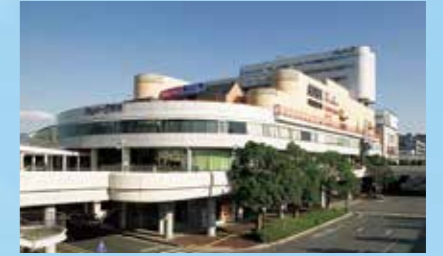
三井ショッピングパーク アルパーク

広島初の複合ショッピングセンターとして、1990年にオープン。「全ての人が楽しく過ごす、公園・憩いの場」をコンセプトに、幅広いお客さまに愛され続けています。