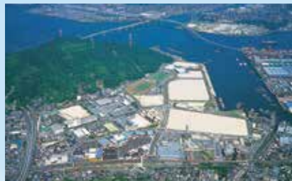
広島港坂地区開発(坂ベイサイドエリア)

複合都市として発展し、ウォーターフロントならではの風景も美しい「坂ベイサイドエリア」。約60ヘクタールの広大な敷地には、JR坂駅を中心に商業施設が充実。