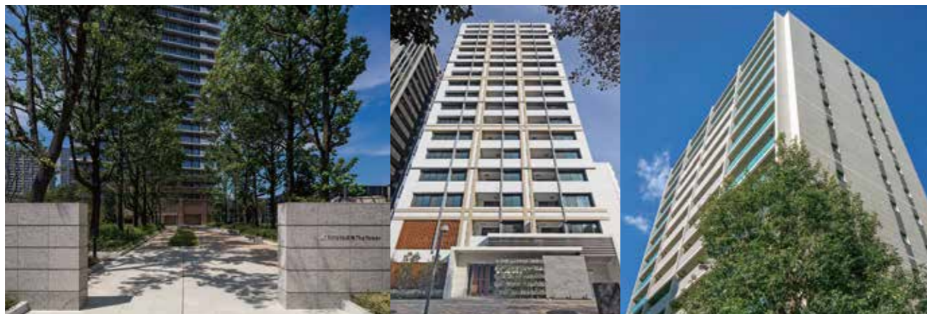
hitoto広島 The Tower

中国エリアでの分譲マンション事業開始は1974年(昭和49年)。地元根差し、時代に先駆けた新しい暮らしを提案してまいりました。時と共に価値を高めていく「経年優化」の思想のもと、一邸一邸に想いを込めて、今後も次代のスタンダードとなるすまいを創造し続けてまいります。