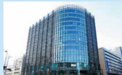
広島トランヴェールビルディング

広島市のビジネス・商業の中心地、紙屋町にある複合用途ビル。ガラスカーテンウォールを採用した、開放的でシンボリックな外観デザインが特徴のオフィスビルです。