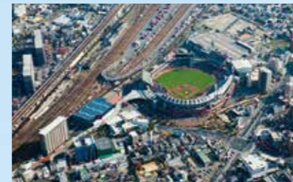
広島ボールパークタウン

「スポーツの感動があふれる街」、球場とともに進化する街」がコンセプト。マツダスタジアムに隣接する、住宅をはじめ様々な施設を備えた大規模複合開発です。 ※マツダスタジアムの開発は除く