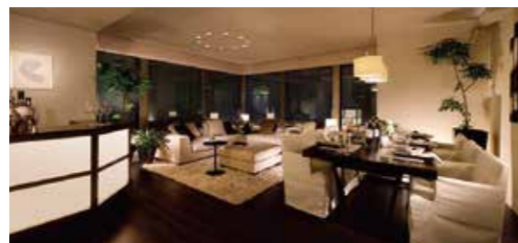
パークホームズ上輪町グランクロワ

私たちは生活する時、様々な空間に包まれています。そうしたすべての空間を快適に演出するプロデューサーとして、デザイン・テクノロジー・コンサルティングを強みに、他社と異なる付加価値の高い成果を創造します。