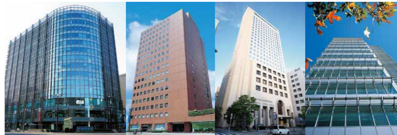
広島トランヴェールビルディング

紙屋町の中心に位置する広島トランヴェールビルディングをはじめ、私たちがマネジメントするビルでは快適なオフィス空間を提供するとともに、関連するソリューションサービスを通じて、単なるオフィスではない様々な“場”としての付加価値を創出しております。