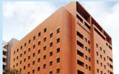
三井ガーデンホテル岡山

岡山県内最大の客室数と、最上階に庭園大浴場を備える宿泊主体型ホテル。JR岡山駅至近に位置し、多くのお客さまにご利用いただいています。