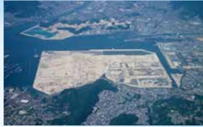
広島東部流通団地(海田湾埋立)

昭和40年代後半、広島市が計画した海田湾埋立造成工事に参画し、誕生した大規模埋立事業。海陸一貫の輸送施設が整った一大流通団地として広島の産業発展に貢献。