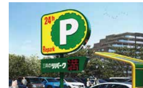
三井のリパーク 時間貸し駐車場

三井のリパークは、街と調和し、安全をもたらしながら、街の活性化に寄与できる施設として駐車場事業を展開しています。豊富な実績から培った知見と技術、そして思いのすべてを注ぎ込み、お客様の土地に最適なプランをご提案いたします。また、お客様の大切な資産を安心してお任せいただくために、万全の運営管理体制をご用意しています。